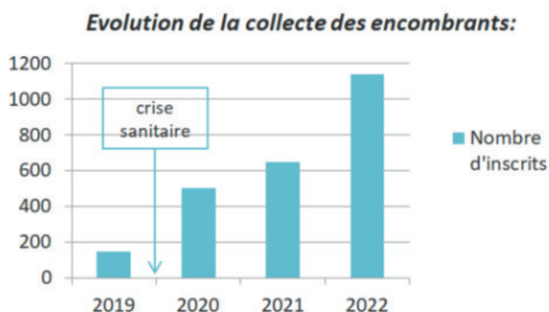
Figure 1 : diagramme représentatif de l'évolution du nombre de rendez-vous de 2019 à 2022.

Face à la crise sanitaire et aux mesures de distanciations mises en place, le service des encombrants en porte à porte a bénéficié d'un réel regain d'intérêt depuis 2020. Effectivement, le nombre de rendez-vous est forte augmentation puisqu'il est passé de 147 rendez-vous en 2019 à 1 140 en 2022 (cf. Figure 1).