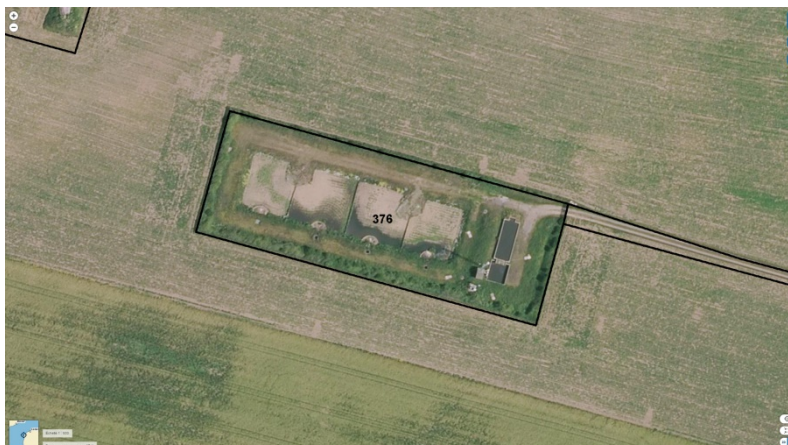
STEU n°2 : Audinghen Station du Gris Nez

Code Sandre de la Station : 010780600000