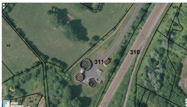
STEU n°5 : Ferques

Code Sandre de la Station : 014027800000