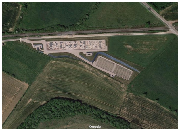
STEU n°6 : Landrethun Le Nord