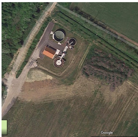
STEU n°8 : Réty

Code Sandre de la Station : 010832500000