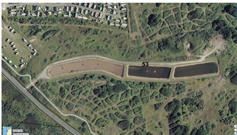
STEU n°3 : Audresselles

Code Sandre de la Station : 010506400000