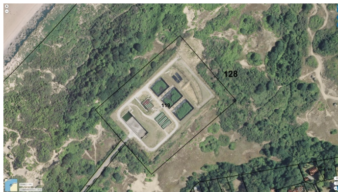
STEU n°9 : Wissant

Code Sandre de la Station : 011007500000