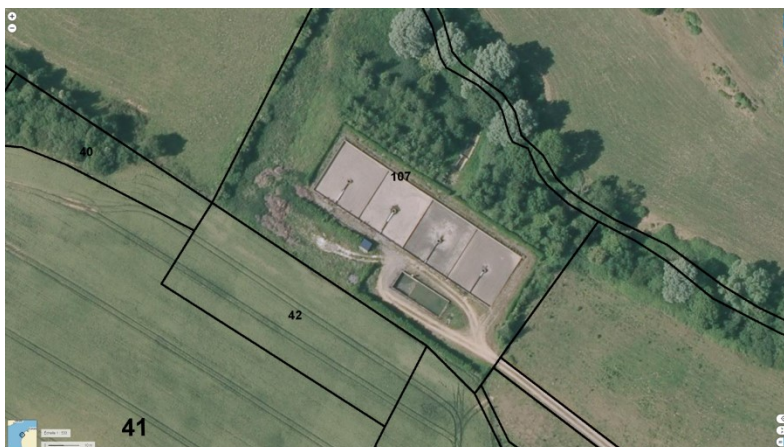
STEU n°1 : Audinghen Station du bourg

Le service gère 9 Stations de Traitement des Eaux Usées (STEU) qui assurent le traitement des eaux usées :