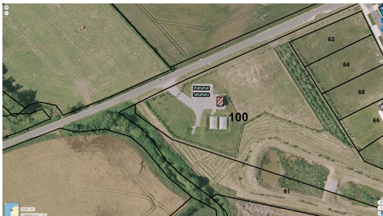
STEU n°4 : Beuvrequen